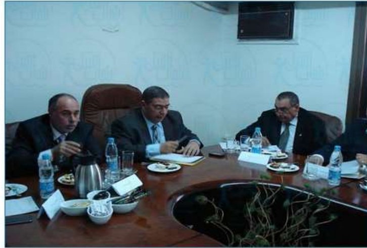
اجتماع مجلس ادارة شعبة الحاسبات الآلية