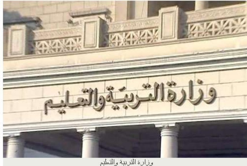
وزارة التربية والتعليم

أعلنت الشعبة العامة للحاسبات الآلية والبرمجيات التابعة للاتحاد العام للغرف التجارية عن أسماء الشركات 19 التي قامت بسحب كراسات الشروط الخاصة بتأهيل الشركات للعمل بمبادراتها الجديدة "تنوير" والتي تتم بالتعاون مع وزارة التربية والتعليم - صندوق دعم وتمويل المشروعات التعليمية، وتمويل من بنك مصر بقيمة 300 مليون جنيه.