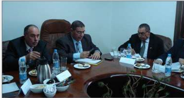
الشعبة العامة للحاسبات الآلية والبرمجيات التابعة للاتحاد العام للغرف التجارية