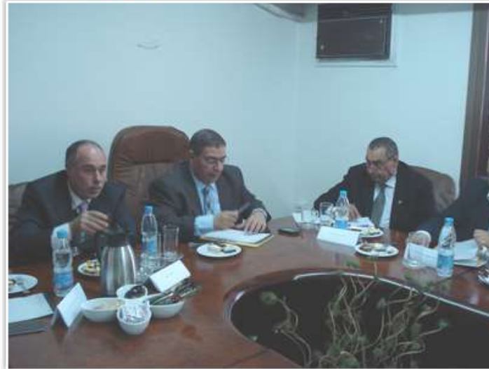
صورة من الاجتماع