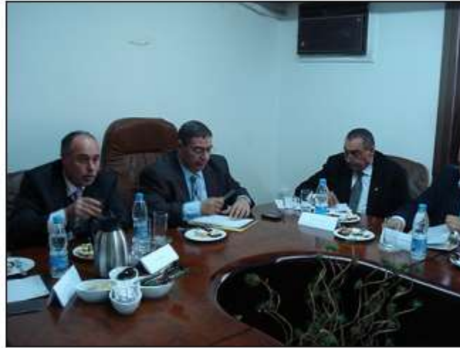
خلف من الاجتماع