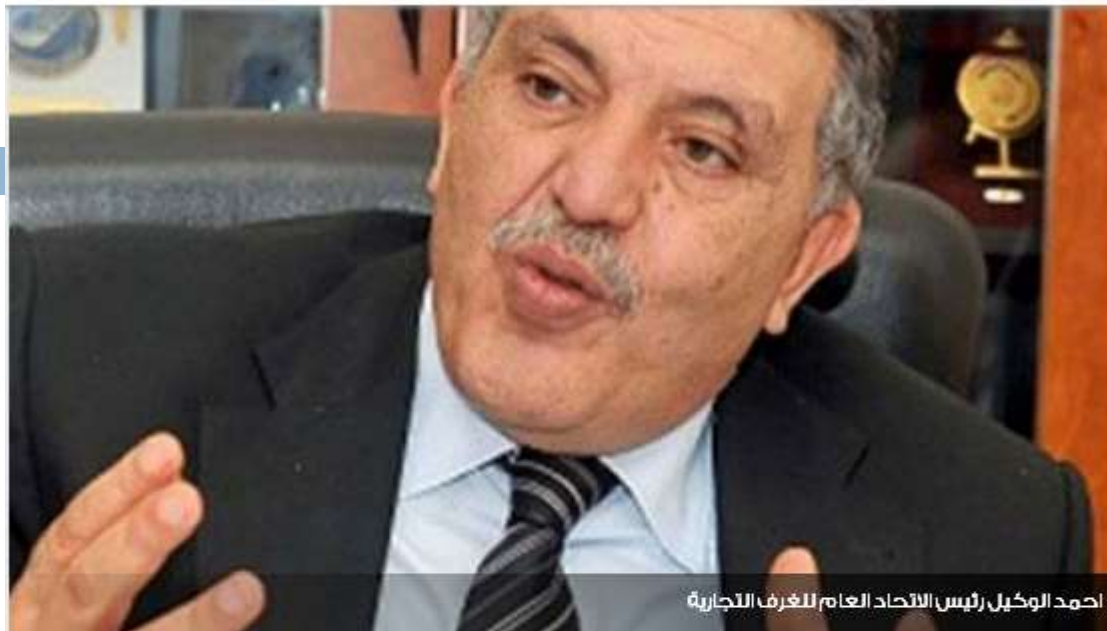
احمد الوكيل رئيس الاتحاد العام للغرف التجارية